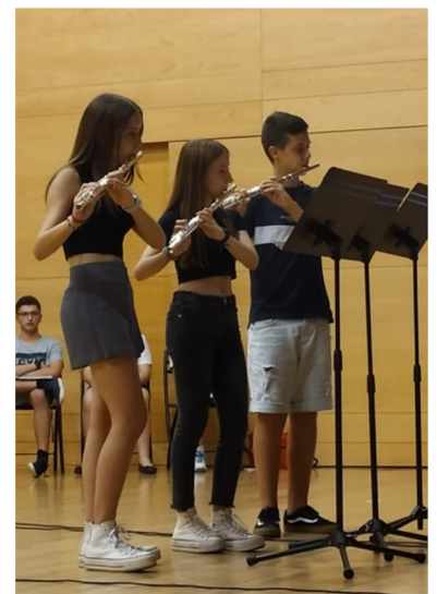
Alumnos de flauta en la audición de fin de Curso

En definitiva, avanzamos en la buena dirección y observamos como nuestra escuela se afianza como la mayor escuela de música de Paterna con más de 270 alumnos, lo que nos enorgullece y anima a seguir trabajando con las mismas ganas del primer día.