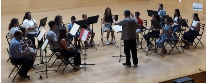
Audición de final de curso del ensemble formado por el alumnado de clarinete