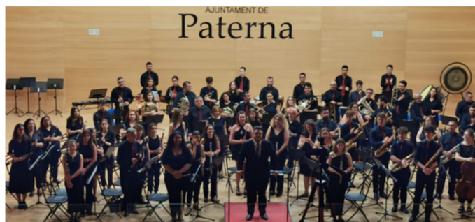
Festival de Bandas Auditorio Antonio Cabeza 16 de julio del 2023

Banda Sinfónica del Centro Musical Paternense