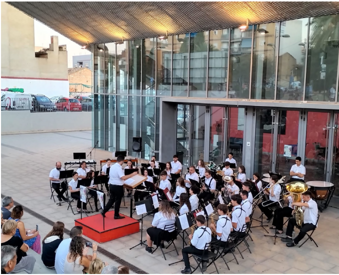
Banda juvenil del CMP en el intercambio organizado por la FSMCV el 12 de julio.