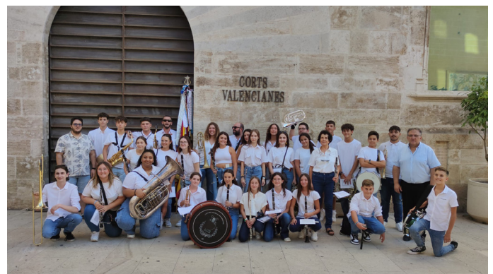
Banda juvenil del CMP en el concierto multitudinario organizado por la FSMCV el 8 de septiembre.

Así, su primer desfile animando las calles de Paterna tuvo lugar el sábado 17 de agosto, con un recorrido que iba desde el ayuntamiento hasta CEIP «La Torre», interpretando marchas cristianas y pasodobles, repertorio propio de la Gran Noche Cristiana. Esa misma noche tuvieron un doblete, ya que no se conformaron con abrir el desfile, sino que después acompañaron a la Comparsa Zíngaras. Al día siguiente, domingo 18 de agosto, repitió el desfile inicial de subida, en esta ocasión desfilando al ritmo de marcha mora para inaugurar la Gran Noche Mora. Por otra parte, el 8 de septiembre, la banda juvenil participó en el concierto multitudinario de bandas juveniles organizado por Presidencia de la Generalitat Valenciana y la Federación de Sociedades Musicales de la Comunitat Valenciana con motivo de la recuperación de la asignatura de música en 3ºESO. La banda, junto con otras 29 de sociedades musicales de la provincia de Valencia, interpretó a los pies del Miguelete cinco pasodobles: Fiestas en Benidorm, Amparito Roca, Xàbia, Paquito el Chocolatero y Pérez Barceló.